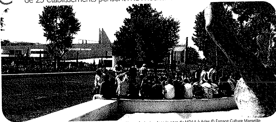
Les Rencontres d'Averroès junior dans le parc du MDAA à Arles

À l'heure où les 5 e s'engouffraient dans les salles du MDAA pour découvrir les messages des marins et des pêcheurs laissés sur terre et au fond de l'eau, les 6 e option environnement apprenaient à regarder la ville, l'architecture, les traces du temps et ce qu'elles nous enseignent sur l'histoire des peuples. De chaque côté de la Méditerranée bien sûr, grâce aux incessants allers-retours linguistiques et historiques de Caroline Grellier qui, photos et documents à l'appui, avait conçu un parcours ludique et pédagogique totale-