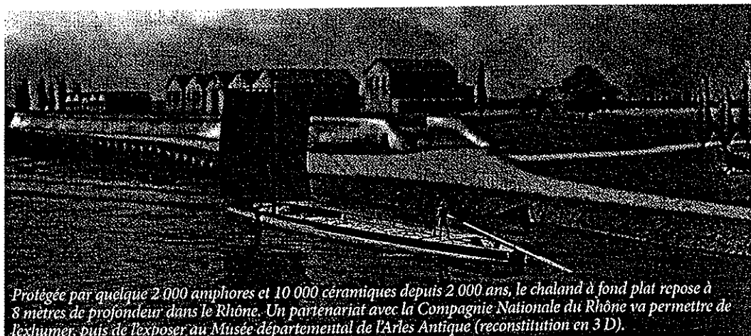
Protégée par quelque 2 000 amphores et 10 000 céramiques depuis 2 000 ans, le chaland à fond plat repose à 8 mètres de profondeur dans le Rhône. Un partenariat avec la Compagnie Nationale du Rhône va permettre de l'exhumer, puis de l'exposer au Musée départemental de l'Arles Antique (reconstitution en 3 D).

mée pour l'association MPCEC 2013, le Département travaille sur plusieurs projets innovants à destination du monde culturel, de la jeunesse et intégrant la révolution numérique. Régulièrement, Accents, tout comme le site Culture13.fr, feront le point sur ces chantiers, qui ne se résument à la mise en place d'une programmation culturelle. Car derrière l'année capitale, se jouent des questions vitales relatives à l'attractivité de notre territoire et à son développement économique.