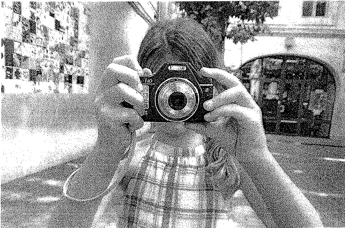
LES ATELIERS DE L'IMAGE ÉCOLE SAINT-THOMAS D'AQUIN

La photographie s'intègre dans le programme scolaire de l'école de Saint-Thomas d'Aquin. Des ateliers réguliers permettent aux élèves de visualiser leur environnement autrement.